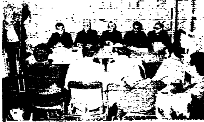
المطران أبو جوده يتحدث في المؤتمر